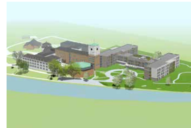
Schets van de eindsituatie met duidelijk zichtbaar H-vormig gebouw; een mooie verbinding tussen de gelegen binnenhoven en het Maasheggen landschap.

'Door contact met daglicht en groen is een healing environment gecreëerd'