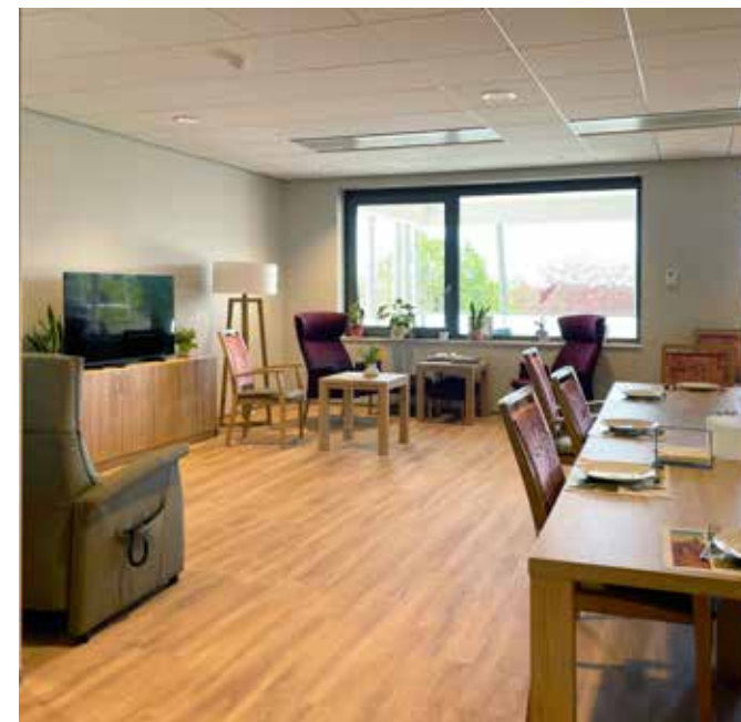
De gezellig ingerichte huiskamers zorgen voor een familiale sfeer en geven bewoners een huiselijk en vertrouwd gevoel. (Beeld: Architectenbureau De Witte Oss)