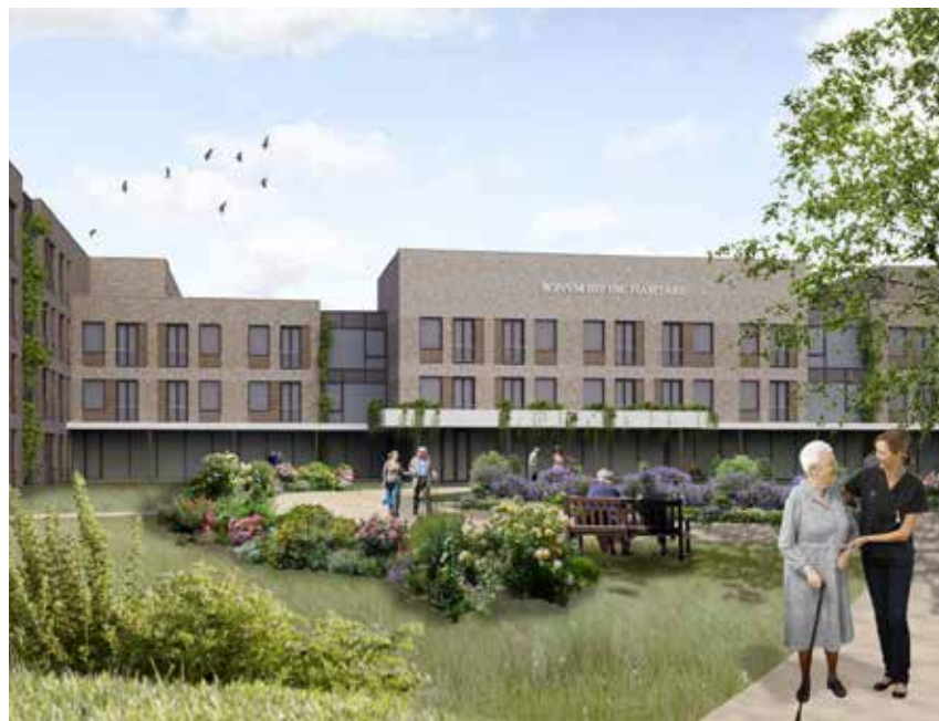
Het vele groen zorgt voor een healing environment. (Beeld: Bouwbedrijf Berghege; Architectenbureau De Witte Oss)