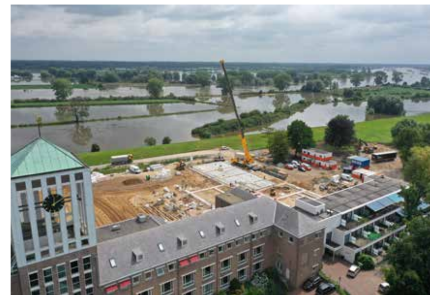
Zomer 2021: Achter de bestaande bouw is begonnen met de nieuwbouw. Door de hoge waterstand is de rivier buiten haar oevers getreden, waardoor delen land onder water zijn komen te staan. Gelukkig zonder gevolgen voor de speciaal aangelegde weg voor het bouwverkeer.