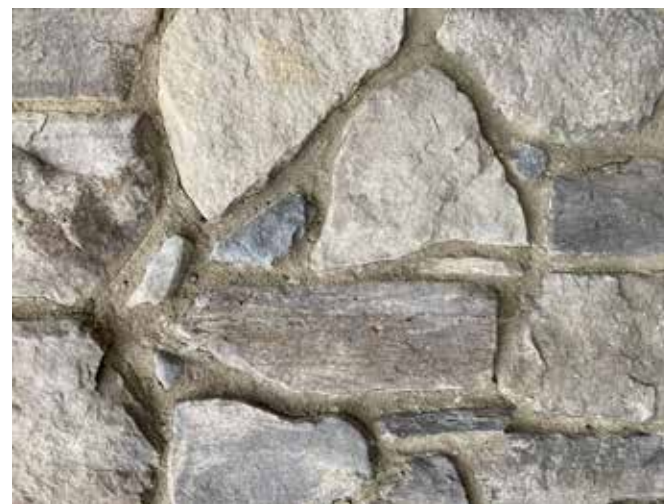
Het bouwproject wordt afgerond door het plaatsen van de Normandische plint, een verwijzing naar het moederhuis van de Zusters van Julie Postel.