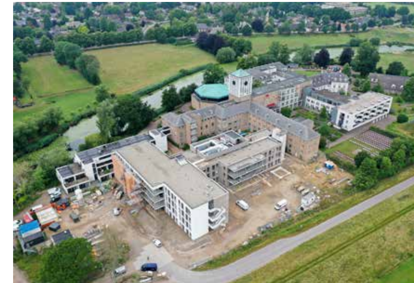
Zomer 2022: Overzicht van de huidige situatie; links vormt zich het uiteindelijke H-vormige gebouw.