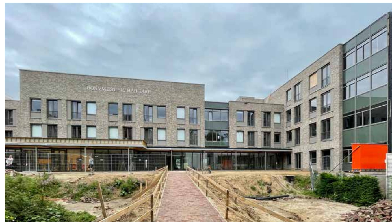
Aanzicht van de gevel. De tekst in Latijn is een verwijzing naar de geschiedenis van de Zusters van Julie Postel en de religieuze achtergrond van Sint Anna. Bonum est hic habitare betekent 'Het is hier goed wonen'.

Een andere uitdaging bleek de leefomgeving van enkele beschermde diersoorten zoals huismussen, bevers, wezels en dwergvleermuizen.