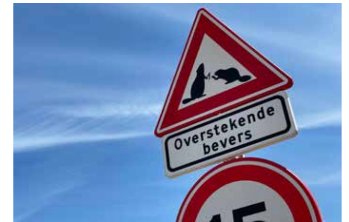
Uitdagingen tijdens de bouw zijn ook op humoristische wijze aangepakt.