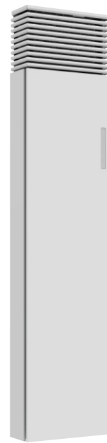
ClimaRad Ventura V1C-C