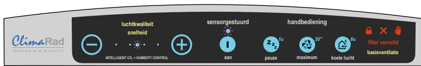
Bedienfeld Typ I

Ihren Radiator bedienen Sie wie immer mit dem Radiatorknopf an der Seite. Die ClimaRad-Lüftungseinheit wird mit dem Bedienfeld an der Oberseite des Radiators bedient.