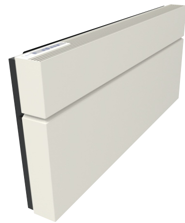
ClimaRad Care H1C